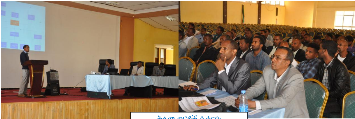
ትልመ ጥናቶች ሲቀርቡ

ደ/ማ/ዩ:- ደብረ ማርቆስ ዩኒቨርሲቲ የምርምርና ማህበረሰብ አገልግሎት ዳይሬክቶሬት የዩኒቨርሲቲው ከፍተኛ አመራሮች፣ መምህራንና ተጋባዥ እንግዶች በተገኙበት የሜጋ ፕሮጀክት ትልመ ጥናት ውይይት አካሄደ።