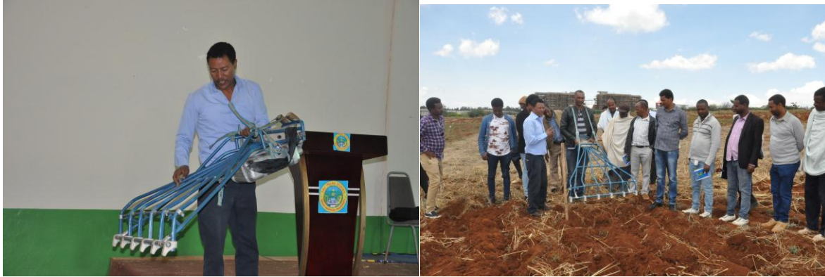
Demonstration on raw seeding machine

DMU: Debre Markos University Choke watershed research and community development project directorate offers training on improved technologies for farmers at 13 centers of excellences. In order to provide new and improved farming technologies, training was conducted for farmers from centers of excellence in DebreMarkos University on April 24/2018.