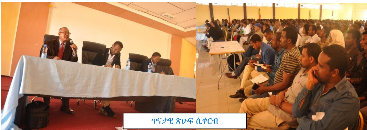
ጥናታዊ ጽሁፍ ሲቀርብ

ደ/ማ/ዩ:- የደብረ ማርቆስ ዩኒቨርሲቲ 77ኛውን የድል ቀን ምክንያት በማድረግ ዓውደ ጥናት አካሄደ። ሚያዝያ 27 ቀን ሲታሰብ ሁሉም የሚያዚያ 27/1928 ኢትዮጵያ የተወረረችበት እና ሚያዚያ 27 ኢትዮጵያ ከአምስት ዓመት ትግል በኋላ ድል ያደረገችበት ስለሆነ የመከራና የድል ቀን ሆኖ ይታሰባል።