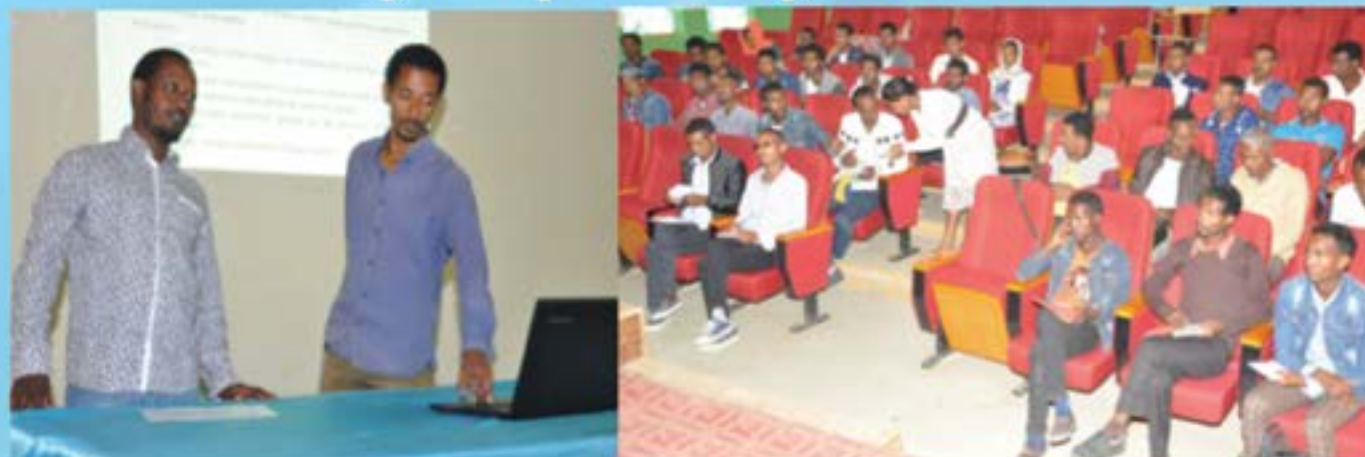
Partial view of the training

Debre Markos University department of physics gives training for Eastern Gojjam Zone Secondary and Preparatory School physics teachers. The University addresses community problems and transfers research output to the society through community services. In community service mission of the university filling the gaps and capacitating professionals in different disciplines is significant. As a result, Debre Markos University physics department teachers give training for East Gojjam zone secondary and preparatory school physics teachers on difficult areas of the subject so as to fill their skill gap. The training was on 'thermodynamics' and 'Electromagnetism'.