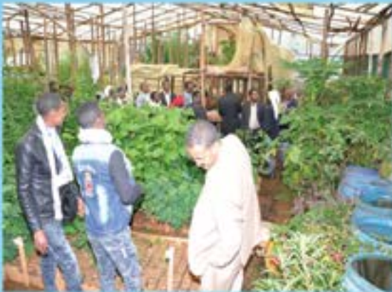
የግቢው ችግኝ ጣቢያ

የግቢው ውበት ለዕድሜዎች እንክብካቤና ለችግኝ ዝግጅት የሚውል 120 ሜትር ከብ የሚሆን የተፈጥሮ ማዳበሪያ (ኮምፖስት) አዘጋጅቷል። በተመሳሳይ የተለያዩ የሳር ዝርያዎችን በማሰባሰብ ራሱን የቻለ ችግኝ ጣቢያ አቋቋሟል። በኢሊና የአየር ንብረት ለውጥ ሳቢያ በተከሰተው ውርጭ ምክንያት ደርተው የነበሩ እድሜዎችን ልዩ ትኩረት በመስጠትና በመንከባከብ መልሶ እንዲያገገሙ ተደርጓል።