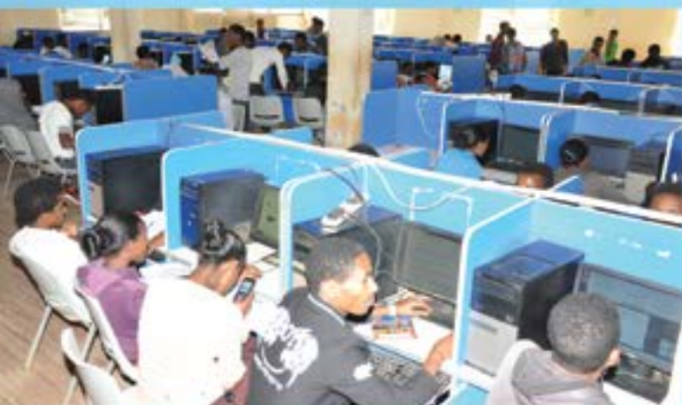
የተማሪዎች ዲጂታል ላይብራሪ

በደብረ ማርቆስ ዩኒቨርሲቲ የአይ.ሲ.ቲ ዳይሬክቶሬት ከሚያከናውናቸው ተግባራት መካከል የአውቶሚሽን ስራዎችን፣ የኔትወርክ አገልግሎትን እና የአይ.ሲ.ቲ እቃዎች በመጠገን ደንበኛ ተኮር የሆነ አገልግሎት ለዩኒቨርሲቲው መምህራን፣ ሰራተኞች እንዲሁም ተማሪዎች ይሰጣል።