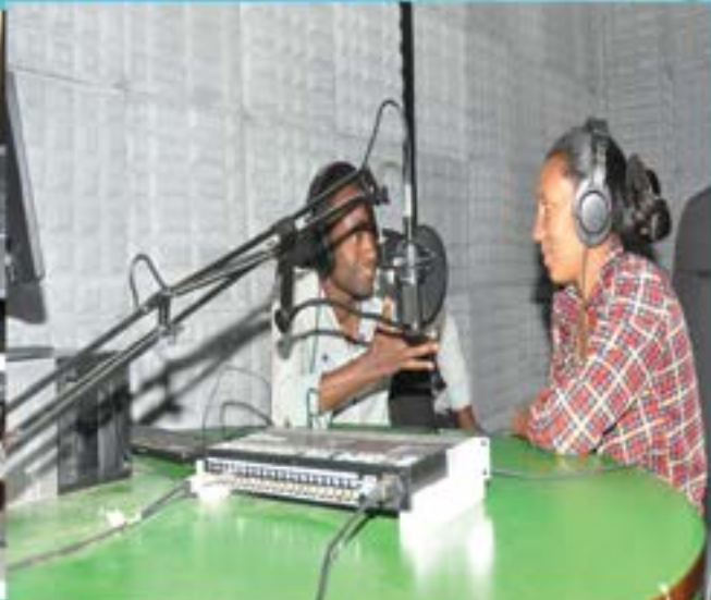
የማህበረሰብ ራዲዮ ጋዜጠኞች በስተዲያ ሥራ ላይ

ለላው ደግሞ የሌሎች ፕሮግራም ሲሆን በዚህ ፕሮግራም በገጠር እና በከተማ የሚገኙትን ሴቶች ያላቸውን ማህበራዊ፣ ፖለቲካዊና ኢኮኖሚያዊ ጉዳዮችን የሚያስሰኝ ፕሮግራም ሲሆን ተሞክሮ ያላቸው ሴቶች በእኩል ቀርበው ልምዳቸውን እያቀረቡ የሚገኙ ሲሆን በተለይም በጎጃም አካባቢ የሌሎችን የስራ ጫና ለመተንተን ያለዕድሜ ጋብቻን በማስተላለፍ ሴቶችን ማስተማር ህብረተሰቡን ማስተማር መሆኑን ጉዳዩ ከሚመክታቸው አካላት ጋር በጥምረት እየሰሩ ይገኛል።