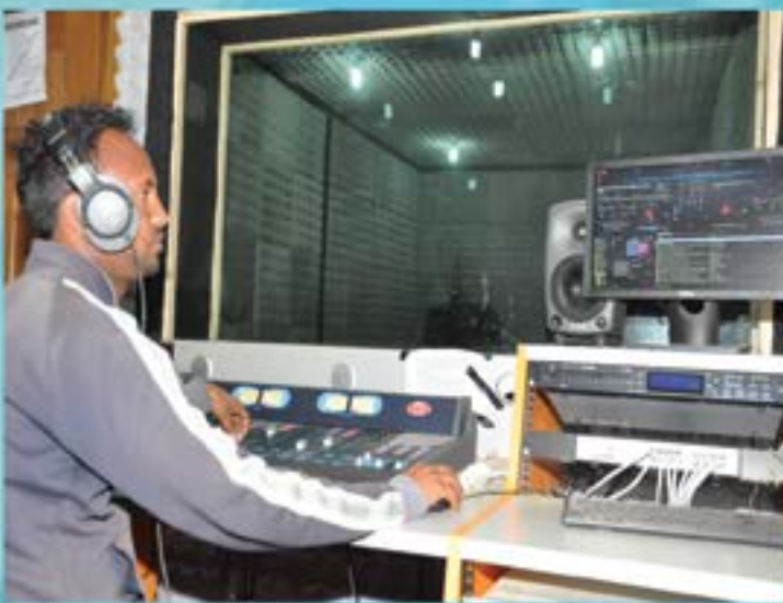
የማህበረሰብ ራዲዮ ተከላኪያን በሥራ ላይ

እንደ ዳይሬክተሩ ገለጻ ራዲዮ ጣቢያው በተጣይ ደግሞ በተለያዩ የትምህርት ክፍሎች የተሰሩ የምርምር ወጤቶችን ተመራማሪው በእኩል ተገኝቶ ለተደራሽ