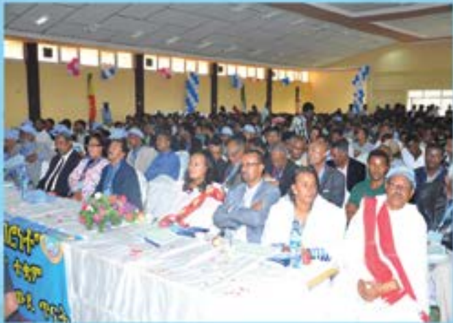
አምስተኛውን ዓመታዊ አገር አቀፍ ዐውደ ጥናት ተሳታፊዎች በካራ

ከባህል ጥናት አንጻር የሐዲስ ዓለማየሁ የባህል ጥናት ተቋም ከተመሰረተ ጀምሮ አራት ዓመታዊ አገር አቀፍ ዓውደ ጥናቶችን በማካሄድ የቀረቡ የምርምር ውጤቶችን በመደበለ ጉባዔ መልኩ ያሳተመ ሲሆን በዚህ ዓመትም የባህል ጥናት ተቋሙ "ባህል ለአንድነት እና ለአብርካት" በሚል መሪ ቃል አምስተኛውን ዓመታዊ አገር አቀፍ ዐውደ ጥናት ሚያዝያ 28-29/2009 ዓ.ም አካሂዷል።