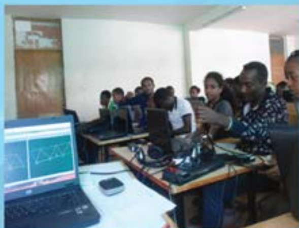
ተማሪዎች የሶፍትዌር ስልጠና ሲወስዱ

የደብረ ማርቆስ ዩኒቨርሲቲ የተማሪዎች ህብረት የዩኒቨርሲቲውን የቀድሞ ተመራቂ ተማሪዎች ሁለተኛ መደበኛ ጉባዔ አዘጋጅቶ ወይይት በማድረግ በተጣይ የአባላቱን ቁጥር በመጨመር የዩኒቨርሲቲውን ተማሪዎች በተለያዩ ጉዳዮች ላይ እንዲሳተፉ ለማድረግ ሰርቷል። ተማሪዎች በበኩላቸው ለዩኒቨርሲቲው 28 መጽሀፍትን በስጦታ በማበርከት እርጋናቸውን አሳይተዋል። በአጠቃላይ የደብረ ማርቆስ ዩኒቨርሲቲ የተማሪዎች ህብረት በዩኒቨርሲቲው ሰላማዊ የመማር ማስተማር ሂደት ተጠናክሮ እንዲቀጥል ለማድረግ፣ ተማሪዎችን በዕውቀት፣ በእውቀት፣ በክህሎት፣ በፈጠራና በምርምር የዳበሩ እንዲሆኑ፣ በስነ-ምግባራቸው ታንግሎ እንዲወጡ በማድረግ ረገድ እየተጫወተ ያለው ሚና ከፍተኛ ነው።