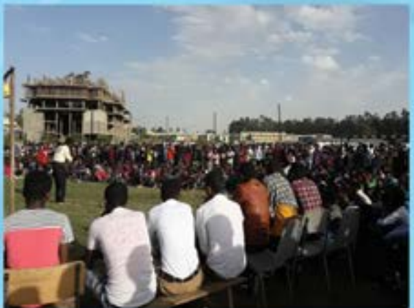
የተሰጥዖ ውድድር ሲካሄድ

በከበባትና ማህበራት ዘርፍም የተማሪዎችን ተሰጥዖ፣ ክህሎት፣ የፈጠራና ምርምር አቅም የሚያዳብሩ፣ የዩኒቨርሲቲውን ገፊት የሚገቡ፣ የአካባቢውን ማህበረሰብ የሚያስተምሩ፣ እንዲሁም የመንግስት የትኩረት ፖሊሲዎችን የሚያስፈጽሙ 12 ማህበራትና 16 ከበባት በማቋቋም ዘርፈ ብዙ ተግባራትን በመስራት ላይ ይገኛል። በተጨማሪም በበጎ አድራጎት ዘርፍ ረዳት የሌላቸውን ተማሪዎች መረጃ በመስጠት ከስርዓተ ያታና ኢች አይ ቪ ኤድስ ዳይሬክቶሬትና አካል ጉዳተኛ ተማሪዎች ዳይሬክቶሬት ጋር በመተባበር 450 ተማሪዎችን በመመልመል እርዳታ በየውሩ እንዲያገኙ አስችሏል። ያልተመለመሉ ረዳት የሌላቸው ተማሪዎች የህብረቱ የገቢ አሰባሳቢ ኮሚቴ በማቋቋም