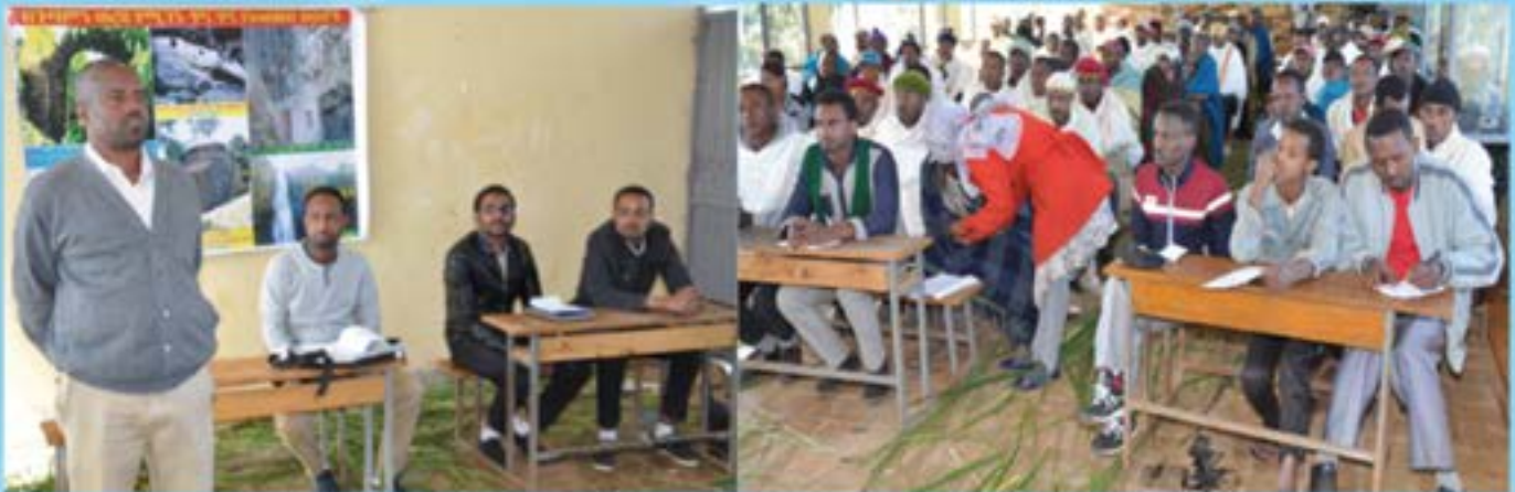
Training on harmful traditional practices to Chertekel Kebele dwellers

Debre Markos University Community Service Directorate in collaboration with School of Law, Health Science College and Social Science and Humanities College gives training on harmful traditional practices to Chertekel Kebele dwellers at Haddis Alemayehu Secondary School.