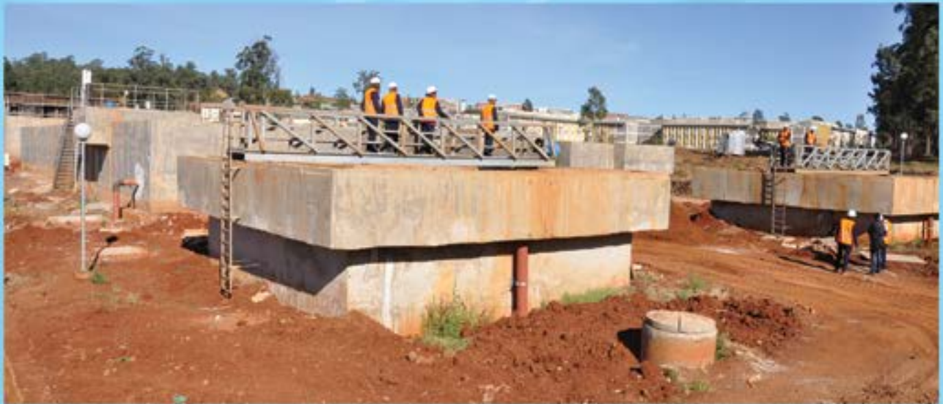
የፍላጎት ቆሻሻ ማስወገጃ

► ከዚህ በተጨማሪ ዘርፍ ግቢውን ማብቃት ውብና ማራኪ ለማድረግ ተገቢውን ትኩረት ሠጥቶ በመስራት ላይ ይገኛል። ለዚህም የተለያዩ የአበባና ውበት ስጭ የዛፍ ዝርያዎች የተተከሉ ሲሆን እነዚህን የመንከባከብ ስራ ተጠናክሮ ተጥሏል። እገር በቀልና የውጭ የዛፍና የአበባ ዝርያዎችን ችግኝ ጣቢያ በማቋቋም፣ በማፍላትና በመትከል ግቢውን በማስዋብ ላይ የሚገኝ ሲሆን ከዚህ አልፎም ለአካባቢው ማህበረሰብ በማሠራጨት ላይ ይገኛል። ለዚህም በአካባቢው ያሉ የጤና ተቋማትና የተለያዩ መስሪያ ቤቶች እንዲሁም በማህበረሰብ አገልግሎት የተለያዩ ተፋሰሶች ላይ የተተከሉ ችግኞች በአብነት ተጠቃሽ ናቸው። ከዚህ በተጨማሪም በ2009 የበጀት ዓመት የግር ዘር ማግኘት ጣቢያ በማቋቋም የተለያዩ የግር ዝርያዎችን በማግኘት ላይ የሚገኝ ሲሆን እነዚህ የግር ዝርያዎችም በተለያዩ ተፋሰሶች የሚሠሩ የተፈጥሮ ሃብት ጥበቃ ሥራዎችን ለማጠናከር እንዲተከሉ ለአካባቢው የልማት መስሪያ ቤቶች የሚሠራጨ ይሆናል። በግቢ የተተከሉ የአፕል ዝርያዎችን የመንከባከብና የማስፋፋት ስራም በዘርፉ ትኩረት ተሠጥቶት በዕቅድ ተይዞ ተግባራዊ እንቅስቃሴዎች በመደረግ ላይ ናቸው።