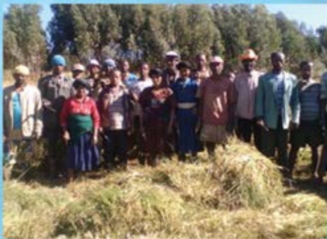
በዌራ ወንዝ ተፋሰስ የታተፉ አርሶ አደሮች የእንሳት ሙና ሲሰጡ

የማህከር አገልግሎት በሥልጠናና ማህከር ዘርፍ በምስራቅ ጉጃም ዞን ከሚገኙ የወረዳ ከተሞች መካከል በደንበኝ ለማህከር፣ አምበር፣ አማኑኤል፣ ረቡዕ ገበያ፣ እና በምስራቅ ጉጃም ዞን ማረሚያ ቤቶች ነፃ የሆነ ድጋፍ አገልግሎት መስጫ ማዕከላትን በመክፈት አገልግሎቱን ይሰጣል። በተጨማሪም በደብረ ማርቆስ ከተማ አስተዳደር ሁለገብ የምክር አገልግሎት መስጫ ማዕከል በመክፈት በሆን፣ በጤና፣ በንግድና ተዋግጅ ሥራዎች እንዲሁም በስነ ልቦና ነፃ የማህከር አገልግሎት በመስጠት ላይ ይገኛል። በሁሉም የምክር አገልግሎት መስጫ ማዕከላት አገልግሎቱን የሚያገኙት በገቅተኛ የኑሮ ደረጃ ላይ የሚገኙ ሴቶች፣ ህፃናት እና ሌሎች ተጋላጭ የህብረተሰብ ክፍሎች ሲሆኑ ከሌምሌ 1/2008 ዓ.ም ጀምሮ በሰባቱ የምክር አገልግሎት መስጫ ማዕከላት 133 ሰዎች ተጠቃሚ እንደሆኑ የማህበረሰብ አገልግሎት ዳይሬክቶሬት ዳይሬክተር አቶ ዘመነ ታረቀኝ ገልጸዋል።