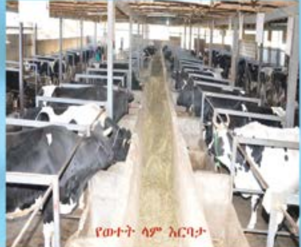
የውተት ላም እርባታ

ሲንተርንጊዶዙ ባለፉት አራት አመታት በወንቱ እርሻ ልማት ፕሮጀክት እና በሱራ እርሻ ልማት ፕሮጀክት ላይ ምርት በማምረት በአጠቃላይ በአራት አመት ውስጥ 26,430,954.50 ብር በላይ ጥቅል ገቢ ማግኘት ተችሏል። እንዲሁም ሰብልን በስፋት ከማምረት በተጨማሪ ለእካባቢው ምቹ የሆኑ ዝርያዎችን ከማላመድ አንጻር በርካታ ተግባራት ተከናውነዋል። ለእካባት ያህል በ2005/2006 ምርት ዘመን በወንቱ ፕሮጀክት የማሾን ሰብል ለእካባቢው ተስማሚ መሆኑን ለማረጋገጥ በ1.6 ሄክታር መሬት ላይ የሙከራ ስራ በማከናወን ውጤታማነቱ ተረጋግጦ በ 2006/2007 ምርት ዘመን በ70 ሄክታር ማሳ ላይ በመዘራት 482 ኩንታል ምርት ማምረት ተችሏል። እንዲሁም በ2006/2007 ምርት ዘመንም በወንቱ ፕሮጀክት የተለያዩ ዝርያ ያላቸው የለውዝ፣ አኩሪ እተር፣ ሰሊጥ፣ ማሾ፣ ቦላቱ፣ ጤፍ፣ ማሽላና በቆሎ ሰብሎችን ለእካባቢው ተስማሚ መሆናቸውን ለማረጋገጥ የሙከራ ስራዎች ተከናውነዋል። ከነዚህም ውስጥ በእካባቢው ውጤታማ የሆኑትን የቦሎቱ፣ የሰሊጥና የማሾ ዝርያዎችን በማምረት ላይ ይገኛል።