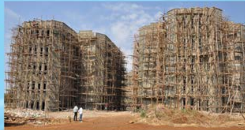
ግንባታ በቡሬ ካምፓስ

በ2010 ዓ.ም የሚጀመሩ አዳዲስ ግንባታዎች ዲዛይን ቀደም ብሎ እንዲሰራ መደረጉ የግንባታ ፕሮጀክት ጽሁፊት ቤት ጥራትን ከማስጠበቅ አንጻር ሁሉም ተቋራጮች የሚገነባቸው ህንፃዎች በዲዛይንና በወጣላቸው ደረጃ መሠረት እንዲሰሩ ያስችላል።