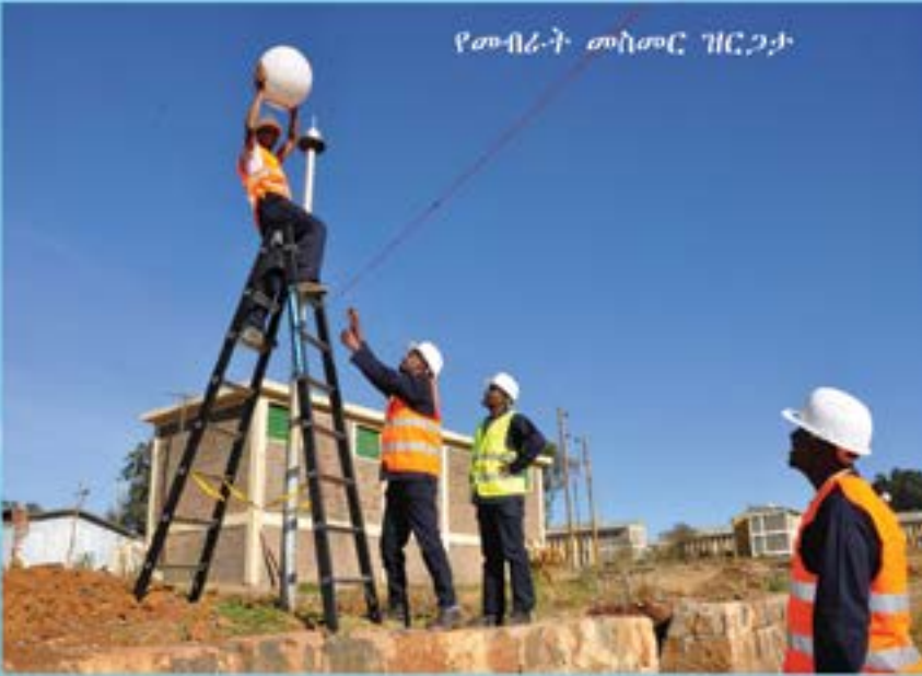
የመብራት መስመር ዝርጋታ

ትምህርት ለእንደ እገር የዕድገት መሠረት ነው። ለዚህም የኒቨርስቲዎች ገበያው የሚፈልገውን የተማሪ የሰው ኃይል በማፍራት በኩል ትልቅ የሆነ ሃገራዊ ኃላፊነት የተጣለባቸው ተቋማት ናቸው። ይህንን ኃላፊነታቸውን ለመወጣት መንግስት ከሚመድብላቸው በጀት በተጨማሪ የራሳቸውን የውስጥ ገቢ ማመንጨት ወሳኝ ነው። ይህም አሠራራቸውን ለማዘመን የሚያስችሉ የአይ.ሲ.ቲ መሠረተ ልማቶችን በማስፋፋትና ለአይ.ሲ.ቲ ተገቢውን ትኩረት በመስጠት፣ ለመማር ማስተማሩ አስፈላጊ የሆኑ የህግ ግንባታና መሠረተ ልማቶችን ተገቢውን ትኩረት ሰጥቶ በጊዜና በጥራት በመፈጸምና የመማሪያ አካባቢዎችንም ውብና ማራኪ በማድረግ የሚፈጸም ሲሆን እነዚህና ተያያዥ ተግባሮች ውጤታማ በሆነ መልኩ ለመፈጸም የእንደ ዘርፍ ብቻ ማይሆን የሁሉም የጋራ ርብርብ የሚጠይቁ ጉዳዮች ናቸው።