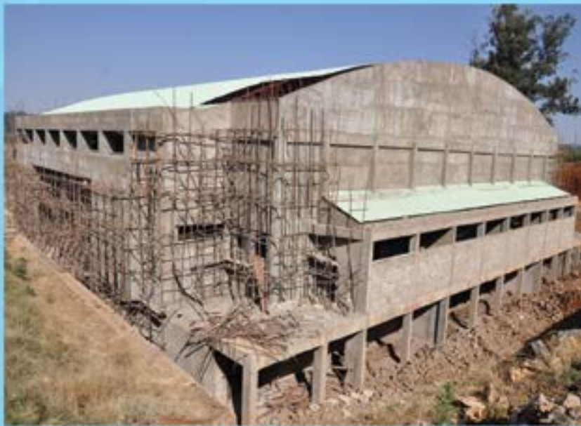
የአደራሽ ግንባታ በዋና ግቢ

የግንባታ ፕሮጀክት ጽ/ቤት ባለሙያዎች በራሣቸው ዲዛይን ተያያዥ ሠነዶችን አዘጋጅተው የፕላንና ዲታይት መሆኑን ቢሮ፣ የመምህራንና ሠራተኞች መዘናኛ ቤት፣ ተጨማሪ የጥበቃ ማማ፣ የተማሪዎች መመገቢያ አዳራሽ፣ የምግብ ማከማቻ ህንፃ እና የሐዲስ አለማዮሁሐውልት የሚቆምበት አደባባይ ተሰርቷል። ከዚህ በተጨማሪም የግንባታ ፕሮጀክት ጽ/ቤት ዲዛይን አዘጋጅቶ በጨረታ ወጥተው እንዲገነቡ የፀደቁትን ሥራዎች የውል አስተዳዳሪ ስራ ይሰራል። በውላቸው የተጠናቀቁና ውላቸውን ያደረጉ ግንባታዎችን የመጨረሻ ክፍያ በአማካሪው ድርጅት ኤም ኤች ኢንጅነሪንግ ተሠርቶ እንዲቀርብ ተደርጓል። በውላቸው መሰረት መስራት ያልቻሉትንም ይጠይቃል፤ ይከላል። ከነዚህም ውስጥ ከዩኒቨርሲቲው በብልጫ በወሰዱት ፖዘብ ክስ እንዲመሰረት የተደረጉት ኢንተርኮንቲኔንታል አሱባለው ኮንስትራክሽን፣ ታዲያም ኢንጅነሪንግ፣ የአብስራ ህንፃ ስራ ተቋራጭ እና ሳሙኤል ምናሰ ህንፃ ስራ ተቋራጭ ይገኙበታል።