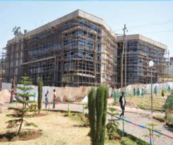
በዋና ግቢ በመገንባታ ላይ ያለ የሠራተኞች መዝናኛ

የግንባታ ፕሮጀክት ጽሁፊት ቤት የሚሠሩ ስራዎች በተያዘላቸው ውል መሠረት ለግንባታው ጥብቅ ቁጥጥርና ክትትል በማድረጉ በዩኒቨርሲቲው ሊደርስ የሚችል አላስፈላጊ ወጭ እንዲሁም የሐብት ብክነት ማስተካከል ችሏል። ዩኒቨርሲቲው በግንባታ ፕሮጀክት ጽ/ቤት ባለሙያዎች አማካኝነት ዲዛይን እና ተያያዥ ስራዎችን መሥራት በመቻሉ ለአማካሪ ድርጅት ሊያወጣ የሚችለውን በሚለያን የሚቆጠር ወጭም ማስተካከል እንደተቻለ ተገልጿል። በመማር ማስተማር፣ በምርምርና ማህበረሰብ አገልግሎት ስራዎች ላይም በመሳተፍ የደብረ ማርቆስ ዩኒቨርሲቲ የኢንጅነሪንግ ተማሪዎች የተግባር ልምምድ እንዲያገኙ ተደርጓል።