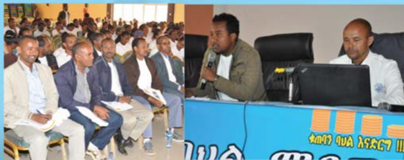
Partial View of the panel discussion

International Women's Day is being celebrated by twinning females' roles in saving culture and renaissance, he added. The enrollment of female students at higher institutions becomes half of the onstrated their population. Thus, female students become 50 percent in Debre Markos University. The increment in the enrollment of female students is not an end by itself, Debre Markos University and concerned bodies should give their respective support to produce competent and efficient female graduates.