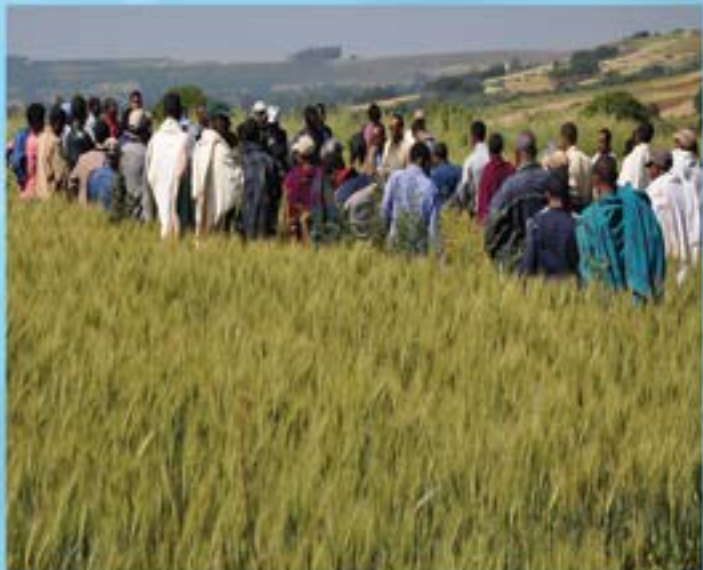
በደጀን ወረዳ በሚሰሩ የሎቂ ምርምር ሥራ ሲገኝ

ከዚህ በተጨማሪ በዚህ ፕሮጀክት እየተከናወነ ያለው ስራ ከተለያዩ የግብርና ምርምር ማዕከላት የሰብል፣ አትክልትና የፍራፍራ ዓይነቶችን በማምጣት ምርምርን መሰረት ያደረገ የማላመድና የሙከራ ሥራ ለመሥራት እንቅስቃሴ እየተደረገ ይገኛል። በ2009 በጀት ዓመት በልህትና ማዕከላት ምርምርን መሰረት ያደረገ የማላመድ ሙከራ ለማካሄድ አራት የምግብ ዝርያዎች፣ ሶስት የቤራ ጉብስ ዝርያዎች፣ ስድስት የዳቦ ስንዴ ዝርያዎች፣ ሶስት የሽምብራ ዝርያዎች እና አራት የባቁላ ዝርያዎች ከግብርና ምርምር ማዕከላት በማስመጣት በተመረጡ የልህትና ማዕከል አርሶ አደሮች ማላ ላይ የማላመድ ሥራ ተከናውኗል። በሰብል ማላመድ የምርምር ስራዎች ላይ የአርሶ አደር በዓል ተዘጋጅቶ ሁሉም የሚመለከታቸው ባለድርሻ አካላት በተገኙበት የመስክ ጉብኝት ስራ ተካሂዷል። ከዚህ በተጨማሪ ሠብሎ ከመሰብሰቡ በፊት አርሶ አደሮች በተገኙበት ለሰብሎች ደረጃ እንዲሠጡ በማድረግ የተሻለውን የሠብል ዝርያ እንዲለዩ በማድረግ ሁሉም ሠብሎች ተሰብስበዋል። ይሁን እንጂ የማላመድ ሙከራ ቢያንስ ለተከታታይ ሶስት አመታት መሰራት የሚገባው ቢሆንም በተለያዩ ምክንያቶች የተሟላ መረጃ ተተንትኖ ይከመንበት አለመሆኑ ችግር ይታያል። አንዳንድ የሰብል አይነቶች ግን ለምሳሌ በለጠ እና ጃላኒ የተባሉ የድንች ዝርያዎች በአሁኑ ሰዓት እየተባዙ ወደ አርሶ አደሩ እየተሰራጩ ይገኛሉ።