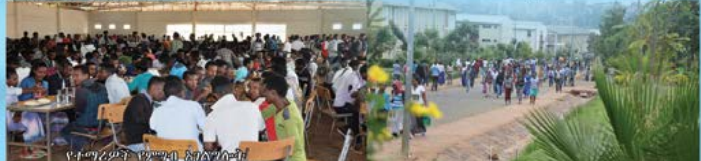
የተማሪዎች የምግብ አገልግሎት

የተማሪዎች አገልግሎት ቢጋራ መግባባት ላይ የተመሰረተና ለሰው ግንኙነት የሆነ የሰው ኃይል እንዲኖርና ጥልቅ ክትትልና ድጋፍ በማድረግ ድክመት ያሳዩ ክፍሎችን ለመደገፍና ለማብቃት ከፍተኛ ጥረት በመደረጉ ውጤታማ መማር ማስተማር እውን እንዲሆን አግቧል።