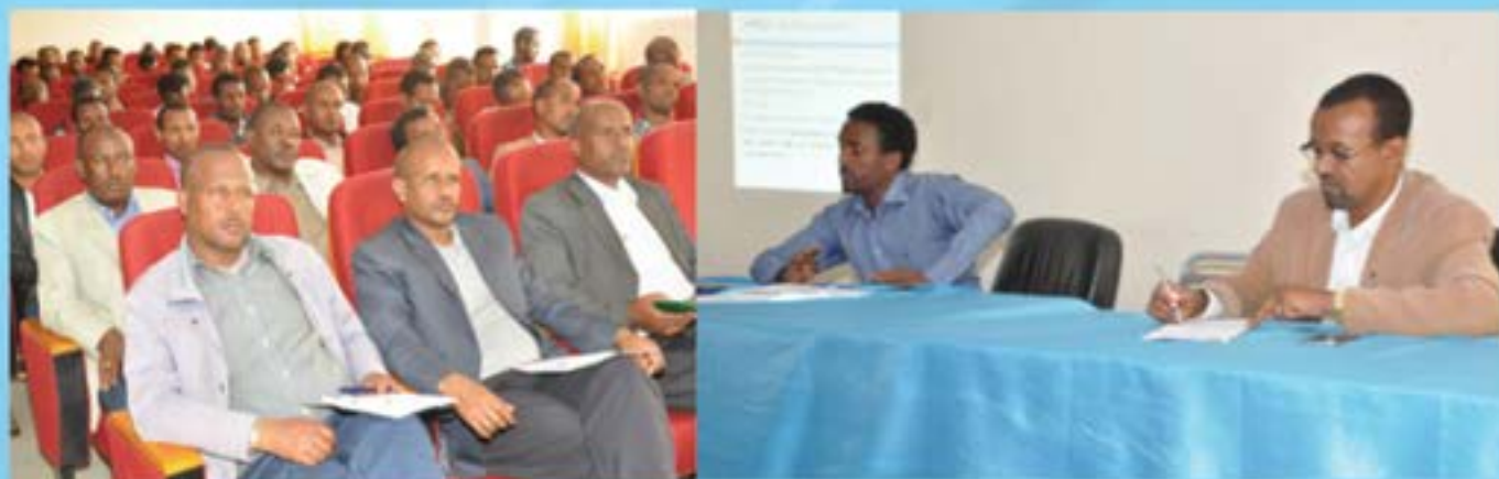
Debre Markos University Leaders' forum members and the community command post discussing on the current situation of the institution and national affairs

Debre Markos University Leaders' forum members and the community command post discuss on the current situation of the institution and national affairs. The discussion is held to create awareness to the community to protect themselves from damage in relation to the declared state of emergency that the country has already on.