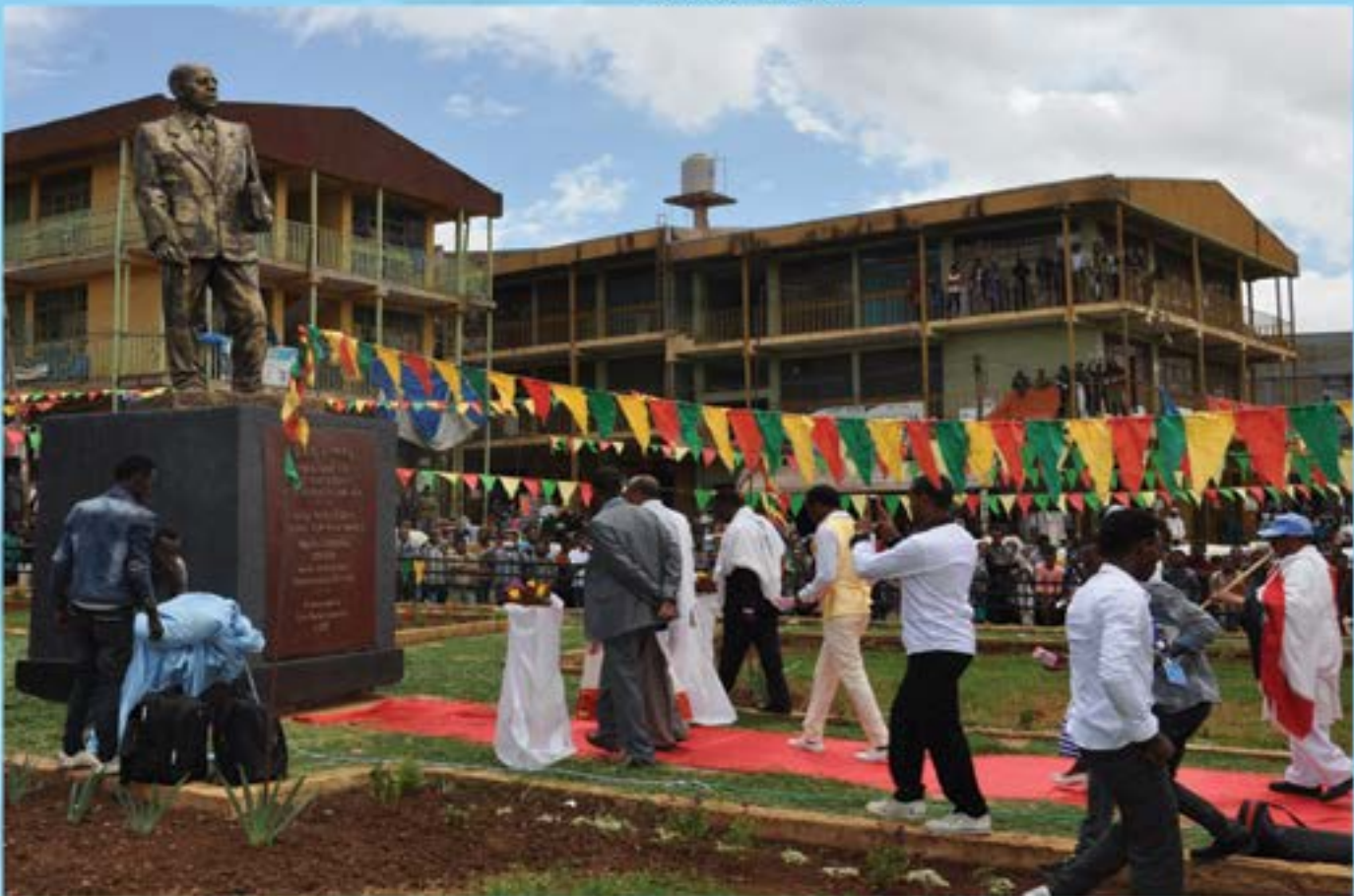
1.2 የሐዲስ ዓለማዊ የባህል ጥናት ተቋም ያስገንባውን ሃውልት ሲያስመርት

በባህል ጥናት ተቋሙ ሃክላመኛ ቋንቋ በሁለት እጅ እነሱ ወረዳ የነበረው ማህበራዊ ፋይዳ እና አሁን ያለበትን ሁኔታ፣ “የገልገልኛ ቋንቋ በደጀን ወረዳ የነበረው ማህበራዊ ፋይዳ እና አሁን ያለበትን ሁኔታ”፣ በርዕሰ ርዕሳን መርጦለማርያም፣ በደብረ ድማሕ ጊዮርጊስ እና በሞግ ደብረገነት ጊዮርጊስ የአንድምታ ትርጓሜ ትምህርት አሠጣጥ ሥርዐት ላይ፣ በብቸና ደብረ ብርሃን ጊዮርጊስ የሚገኙ ጥንታዊ የብራና መጽሐፍ ያላቸው ማህበራዊ ፋይዳ፣ የምስራቅ ጎጃም ዞን ማህበረሰብ ሃገር በቀል አውቶት ያለው ማህበራ-አኮኖሚያዊ ፋይዳ፣ በምስራቅ ጎጃም ዞን ገጠር የሚኖሩ ሲቶች የስራ ጫና፣ እንዲሁም የምስራቅ ጎጃም ዞን ማህበረሰብ ባህላዊ የልጅነት ጨዋታ በሚሉ ርዕሶች ላይ ጥናት ተሰርቷል። እነዚህ ጥናቶችም በቀጣይ ለህብረተሰቡ ተደራሽ እንደሚሆኑ ለመረዳት ተችሏል።