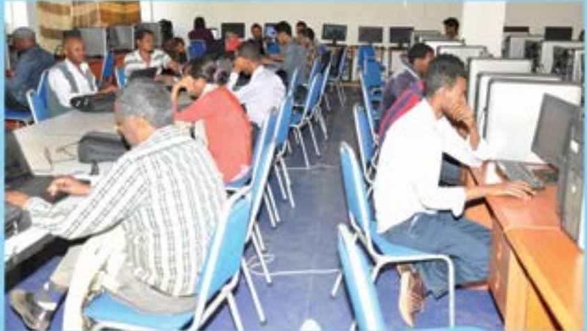
የተማሪዎች የአይሲቲ ማዕከል

በመሆኑም ከተማሪዎች ህብረት ጀምሮ ልዩ ልዩ አደረጃጀቶችን በመጠቀም የዩኒቨርሲቲው ተማሪዎች እርስ በእርስ ተዋህደው የመጡለትን ዓላማ አሳክተው እንዲወጡ ሰፊ ስራ በመስራቱ ላለፉት አመታት እንዲሁም በ 2009 ዓ.ም. በዩኒቨርሲቲያችን የመማር ማስተማር ስራ ሰላማዊ እንዲሆን አስችሏል።