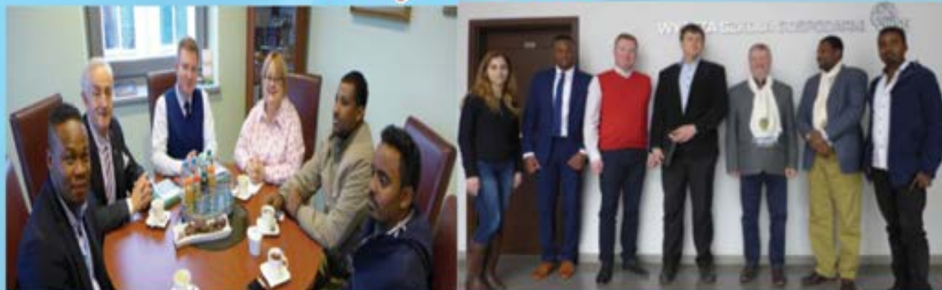
Partial view of DMU delegates Foreign University partners Visit

Debre Markos University delegates conducted paid visit on University of Business and Economics, Computer Science and Skills University of Poland and Hamburg Universities for 15 days with the official invitation from respective universities.