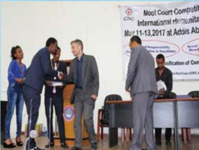
የብር ሚዳሊያ ሲሸለሙ

በውድድሩ ሁሉም የህግ ትምህርት የሚያስተምሩ የመንግስት ክፍተኛ ትምህርት ተቋማት በተለይም ነባር የሚሳሉት የተጋበዙ ሲሆን 16 ዩኒቨርሲቲዎች ተሳትፈው ሁሉም ዩኒቨርሲቲዎች በቅድሚያ የጽሁፍ ክርክር አቅርበዋል።