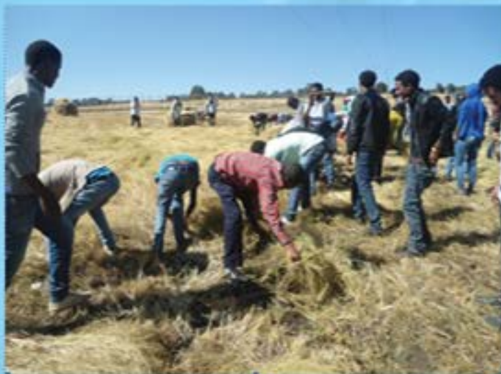
ተማሪዎች የአረጋገጫንን ሰብል ሲሰበሰቡ

ከዚህ በተጨማሪ ተማሪዎች የአካዳሚክ ኮሚሽን /AC/ እና የዲፖርትመንት ካውንስል /DC/ አባል በመሆን በየኮሌጁ በተማሪዎች ላይ በሚወሰኑ ውሳኔዎችና በሚታዩ ጉዳዮች ላይ በጋራ ውሳኔ እንዲሰጡ የተደረገ ሲሆን በተጨማሪም ተማሪዎች ከአንደኛ ዓመት ጀምሮ እርስ በርስ እንዲረዳዱና ሴት ተማሪዎች እንዲታገቡ ከፍተኛ ጥረት ተደርጓል። የደብረ ማርቆስ ዩኒቨርሲቲ የተማሪዎች ህብረት የማህበረሰብ አገልግሎትም ይሰጣል። ከዚህ አንጻር ህብረቱ በ2009 ዓ.ም የግቢውንና የአካባቢውን ቆሻሻ የማጽዳት ዘመቻ፣ በነጻ የህግ አገልግሎት፣ ከ1-8ኛ ክፍል ላሉ ተማሪዎች የማጠናከሪያ ትምህርት፣ የችግኝ ተኮላ እና የአረጋገጫን ሰብል ስብሰባ በማካሄድ ህብረተሰቡን ለማገዝ ጥረት ተደርጓል።