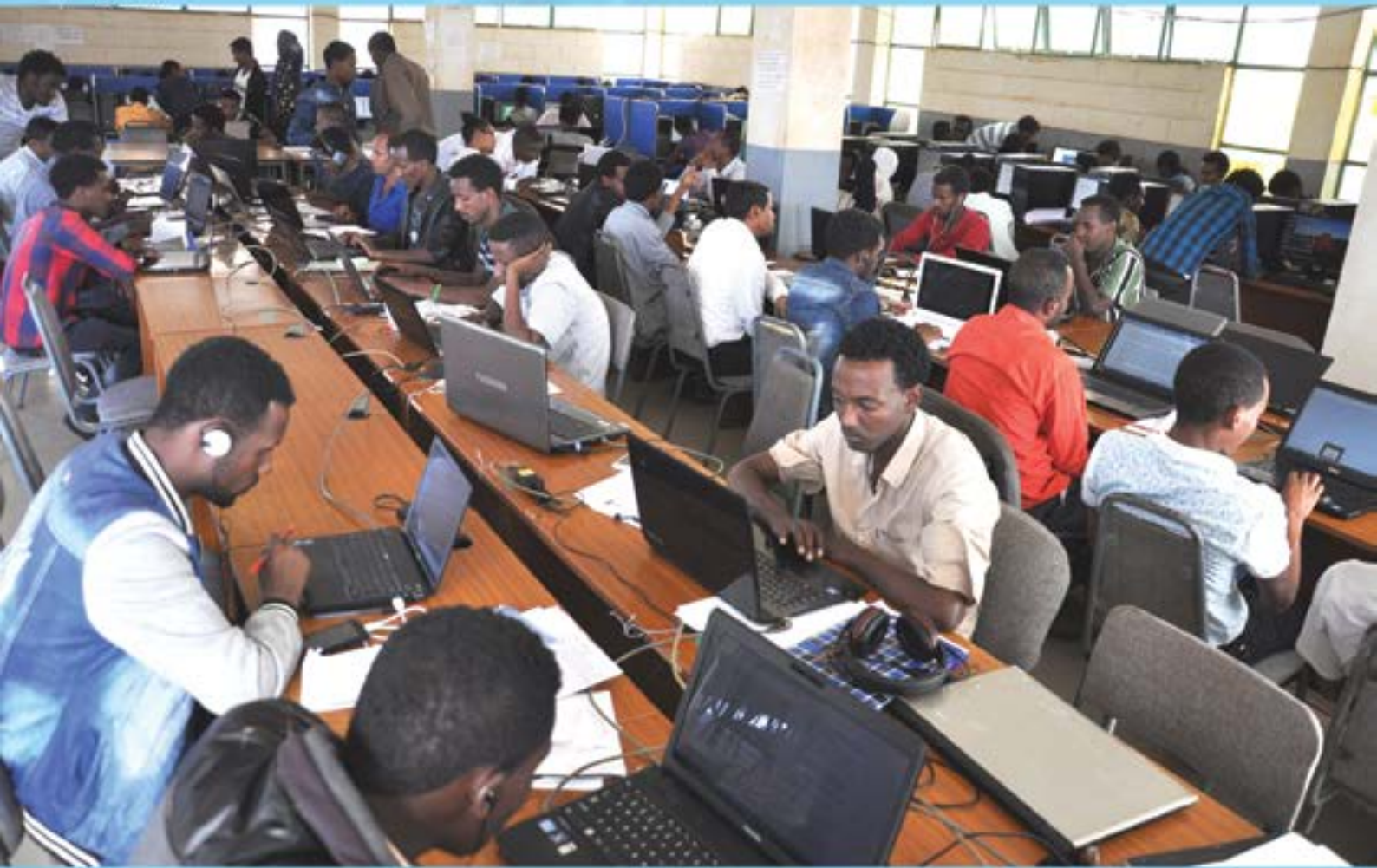
የተማሪዎች የአይ.ሲ.ቲ ቤተ-መክራ

በአይ.ሲ.ቲ ዳይሬክቶሬት የሚዘረጉ ሥርዓቶች በሙሉ የዩኒቨርሲቲውን ገፅ ሲቀይሩ የሚችሉ ናቸው። ስለዚህ ተገቢውን ስልጠናና እውቀትና የመፍጠር ስራ በመስራት በገንዘብ ችግር ምክንያት ወደ ስራ ያልገቡ ወደ ሥራ እንዲገቡ በትጋት እየተሰራበት ይገኛል። ምንም እንኳን የዩኒቨርሲቲው አይ.ሲ.ቲን ለማጠናከር የተለያዩ ሙከራዎችን ቢያደርግም በተለያዩ ጊዜ የሚያጋጥመው የበጀት እጥረት እና የአይ.ሲ.ቲ መሰረተ ልማቶች የሚጠይቁት በጀት ከፍተኛ መሆን እስካሁን መስራት አልተቻለም። ቢሆንም ወደፊት ደረጃውን የጠበቀ የአይ.ሲ.ቲ መሰረተ ልማቶች የሚሰሩበት መንገድ ተፈጥሮ የሚሰጡት አገልግሎቶችን አሁን ካሉበት ደረጃ ከፍ በማድረግ ዳይሬክቶሬቱ ለዩኒቨርሲቲው እቅዶች መሳካት ያለውን ሚና ይጫወታል።